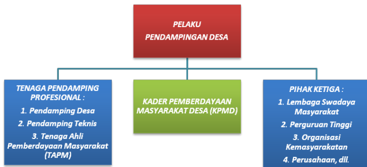
Gambar 1. Pelaku-pelaku Pendampingan Desa

Selain itu dalam ketentuan PP Desa maupun Permendesa disebutkan bahwa KPMD dipilih dari masyarakat setempat oleh pemerintah Desa melalui Musyawarah Desa untuk ditetapkan dengan keputusan kepada Desa. Maksudnya semakin terang bahwa KPMD merupakan individu-individu yang dipersiapkan sebagai kader yang akan melanjutkan kerja pemberdayaan di kemudian hari. Oleh karenanya, kaderisasi masyarakat Desa menjadi sangat penting untuk keberlanjutan kerja pemberdayaan sebagai penyiapan warga desa untuk menggerakkan seluruh kekuatan Desa.